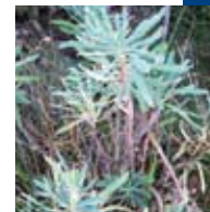
LLETERESA ( Euphorbia characias )