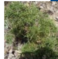
CÀDEC ( Juniperus oxycedrus )