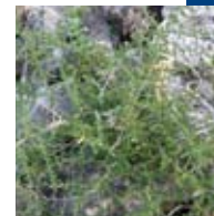
ESPARREGUERA ( Asparagus acutifolius )